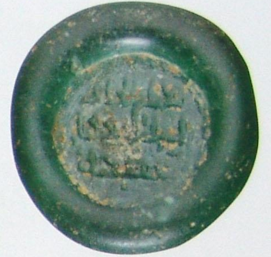
صنع زجاج فاطمية الحاكم بأمر الله

The Fatimide state was established in North Africa and its founder issued similar coins to those of the first Abbaside Dynasty period with the addition of ("Abdullah, the Amir of Faithful"), (Al-Imam, Al-Mahdi Billah). Al-Muiz Lideen Illah issued his coins in a different way that distinguished the Fatimide state from those of the other states, in terms of the round shape, words, emblems). We also find several glass measures that were used by the Fatimides as standards for the Dirhams and Dinars.